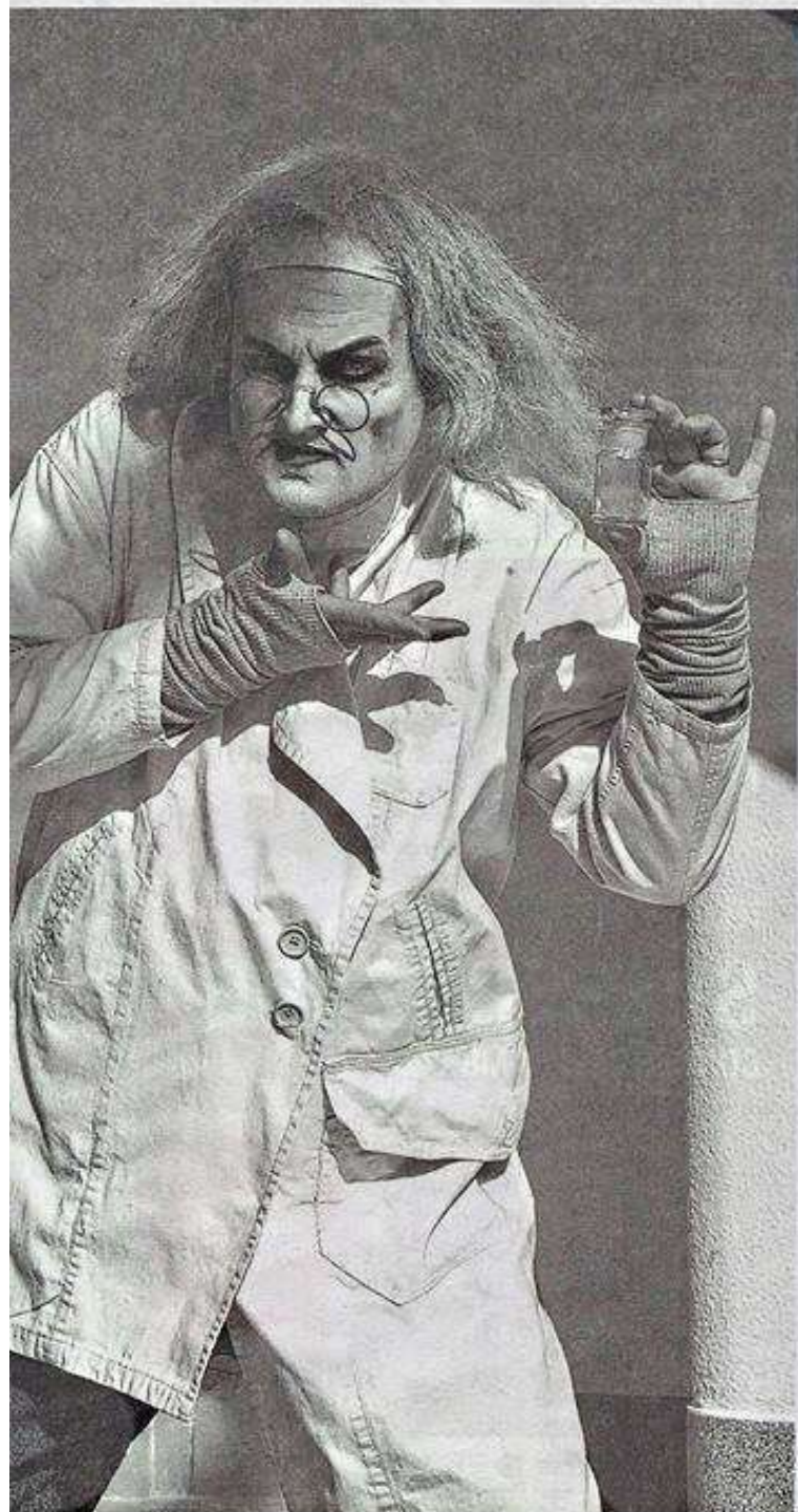
Différent, le « monstre » est l'objet de moquerie et est finalement chassé.

Frédéric Ghesquière crée « Monstres ! », un conte noir, sans parole, avec un comédien sourd dans la distribution. Inspiré du cinéma muet, le spectacle questionne la normalité.